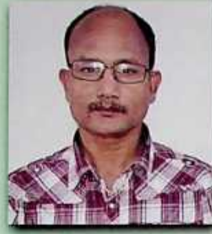
অধ্যক্ষ মায়ং আঞ্চলিক মহাবিদ্যালয়